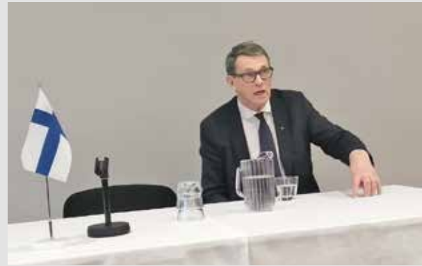
Eduskunnan tänä keväänä jättävä puhemies Matti Vanhanen piti klubilla poliittisen katsauksen (14.3.).