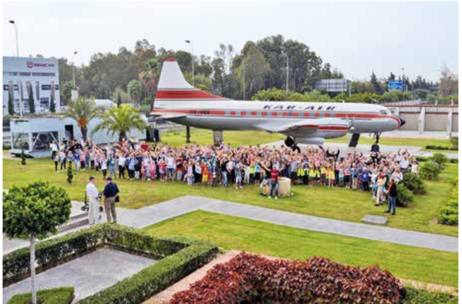
Koululaisia vierailulla Malagan Ilmailumuseossa ja Convair Mertenpolitan 2015.